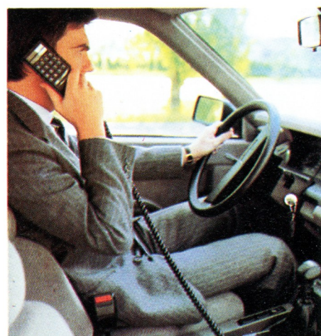
Une utilisation facile.

Fin 1990, vous pourrez téléphoner partout en France et bénéficier de la quasi-totalité des services du réseau téléphonique depuis votre terminal mobile.